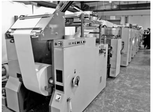
欧州の印刷会社へ納入されるラベル印刷機

ミヤコシ(千葉県習志野市、047・493・3854)は2月20日、21日の両日、宮腰精機・国見工場(秋田県大仙市)において、オフセットVARI 18」が披露される。同組合連合会の田口薫