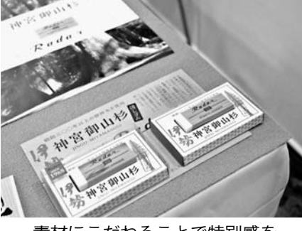
素材にこだわることによって特別感を演出する

企画したのは印刷メーカー。同社が手掛ける紙製品プロトに共感し、1年がかりで発売へ結び付いた