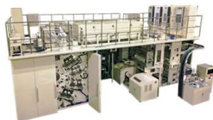
CI型水性フレキソ印刷機 MCI1000-W