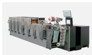
ラベル用間欠オフセット印刷機 MLP series