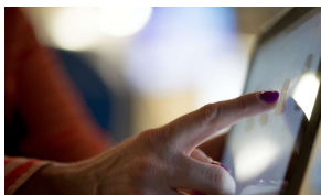
設定操作AIアシストシステム Yaless AI