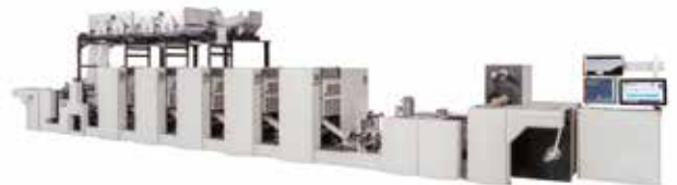
MHL13A スリーブ式オフセット印刷機 MHL13A Sleeve Type Rotary Offset Press