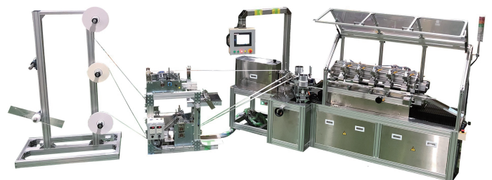
紙ストロー生産機